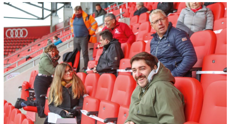
Impressionen von der mit »Abstand« außergewöhnlichsten Delegiertenversammlung der IG Metall Augsburg im Audi Sportpark